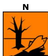
Nebezpečný pro životní prostředí